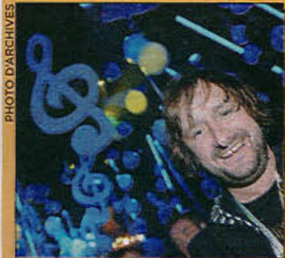
MUSIQUE REMI-PIERRE PAQUIN SE LANCE DANS LA CHANSON

CINÉMA HEATH LEDGER: HOLLYWOOD SE SOUVIENT PAGE 47