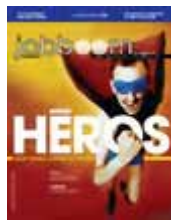
Magazine Jobboom Vol. 6 no. 7 août 2005

recherche et rédaction : Corinne Fréchette-Lessard